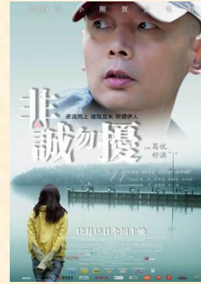
If you are the one (27.07.) OmeU 125min.

Qin (Ge You) ist ein ganz normaler Junggeselle im besten Alter. Beruflich ist er selbstständig und erfolgreich, aber mit der Liebe hatte er bisher kein Glück. Und so entschließt er sich, eine Kontaktanzeige aufzugeben. Es folgt ein Reigen von bizarren Begegnungen und peinlichen Dates. Schließlich lernt er die schöne Xiaoxiao (Shu Qi) kennen. Sie scheint perfekt - fast zu perfekt! Qin zögert, ihr seine Gefühle zu offenbaren. Stattdessen schließt er Freundschaft mit ihr. Doch je mehr Zeit sie gemeinsam verbringen, umso inniger wird die Freundschaft, umso inniger werden die Gefühle beider für einander.