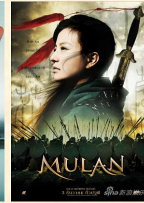
Mulan - Legende einer Kriegerin (29.06.) OmeU 113min.

Qin (Ge You) ist ein ganz normaler Junggeselle im besten Alter. Beruflich ist er selbstständig und erfolgreich, aber mit der Liebe hatte er bisher kein Glück. Und so entschließt er sich, eine Kontaktanzeige aufzugeben. Es folgt ein Reigen von bizarren Begegnungen und peinlichen Dates. Schließlich lernt er die schöne Xiaoxiao (Shu Qi) kennen. Sie scheint perfekt - fast zu perfekt! Qin zögert, ihr seine Gefühle zu offenbaren. Stattdessen schließt er Freundschaft mit ihr. Doch je mehr Zeit sie gemeinsam verbringen, umso inniger wird die Freundschaft, umso inniger werden die Gefühle beider für einander.