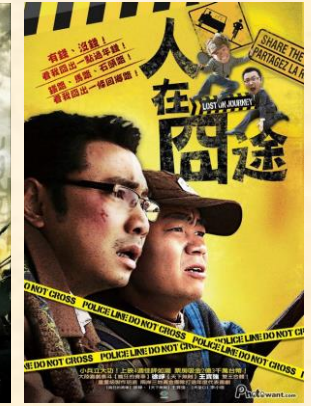
Lost on Journey (28.08.) OmeU 95min.